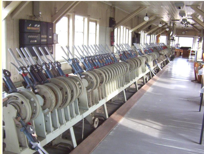
Mechanische Hebelbank im Museum im Obergeschoss

Seit seiner Stilllegung im Oktober 1986 werden die mechanischen Zugsicherungseinrichtungen von den Mitgliedern gepflegt. In mühevoller Kleinarbeit wird die Lehrter Eisenbahngeschichte konserviert und somit für Besucher und Eisenbahninteressierte betriebsbereit gehalten. Mit der Technik, zum Teil aus dem Jahre 1912 (Bauart Jüdel), können heute wieder Fahrstraßen gestellt werden. Durch das Bedienen der Weichen- und Signalhebel und der mechanischen Sicherungstechnik ist das alte Eisenbahnzeitalter „spürbar“.