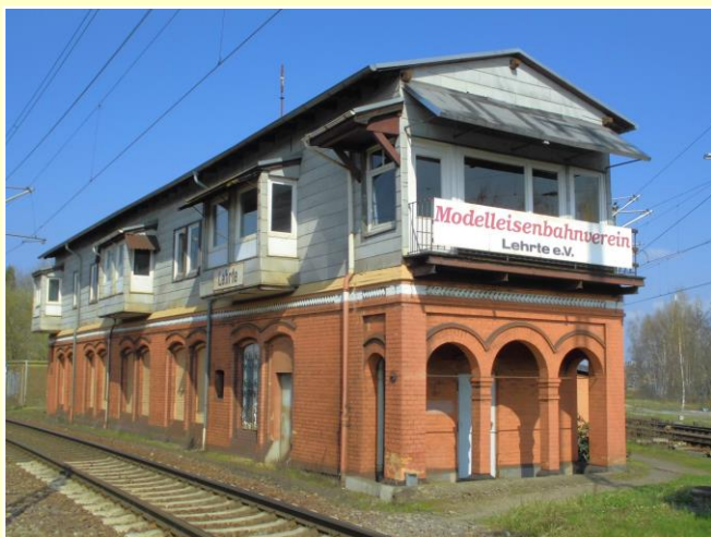
Museumsstellwerk Lpf in Lehrte, Richtersdorf 1

Ihre Mitgliedschaft oder Ihre Spende ist wichtig für die Erreichung des Vereinsziels. Helfen Sie uns beim Erhalt des Stellwerks Lpf, einer Erinnerung an ein vergangenes Eisenbahnzeitalter in Lehrte.