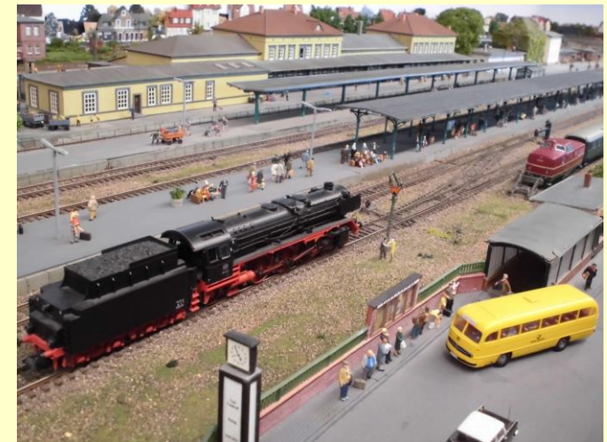
Modell vom Lehrter Personenbahnhof um 1960

Im Erdgeschoss wurden umfangreiche Renovierungsarbeiten durchgeführt. Für die 21 Meter lange und 3 Meter breite Modelleisenbahn des Lehrter Personenbahnhofs um 1960 wurde der ehemalige Spannwerksraum komplett umgebaut. Zahlreiche Gebäudemodelle, die digitale DCC-Modellbahnsteuerung, das PC-Programm RAILWARE®, eine LED-Lichtanlage, umfangreiches Gleis- und Fahrzeugmaterial sind bereits im Einsatz. Die Decoder-Programmierung und alle Dokumentationen werden in der Werkstatt zum Teil an Computern durchgeführt.